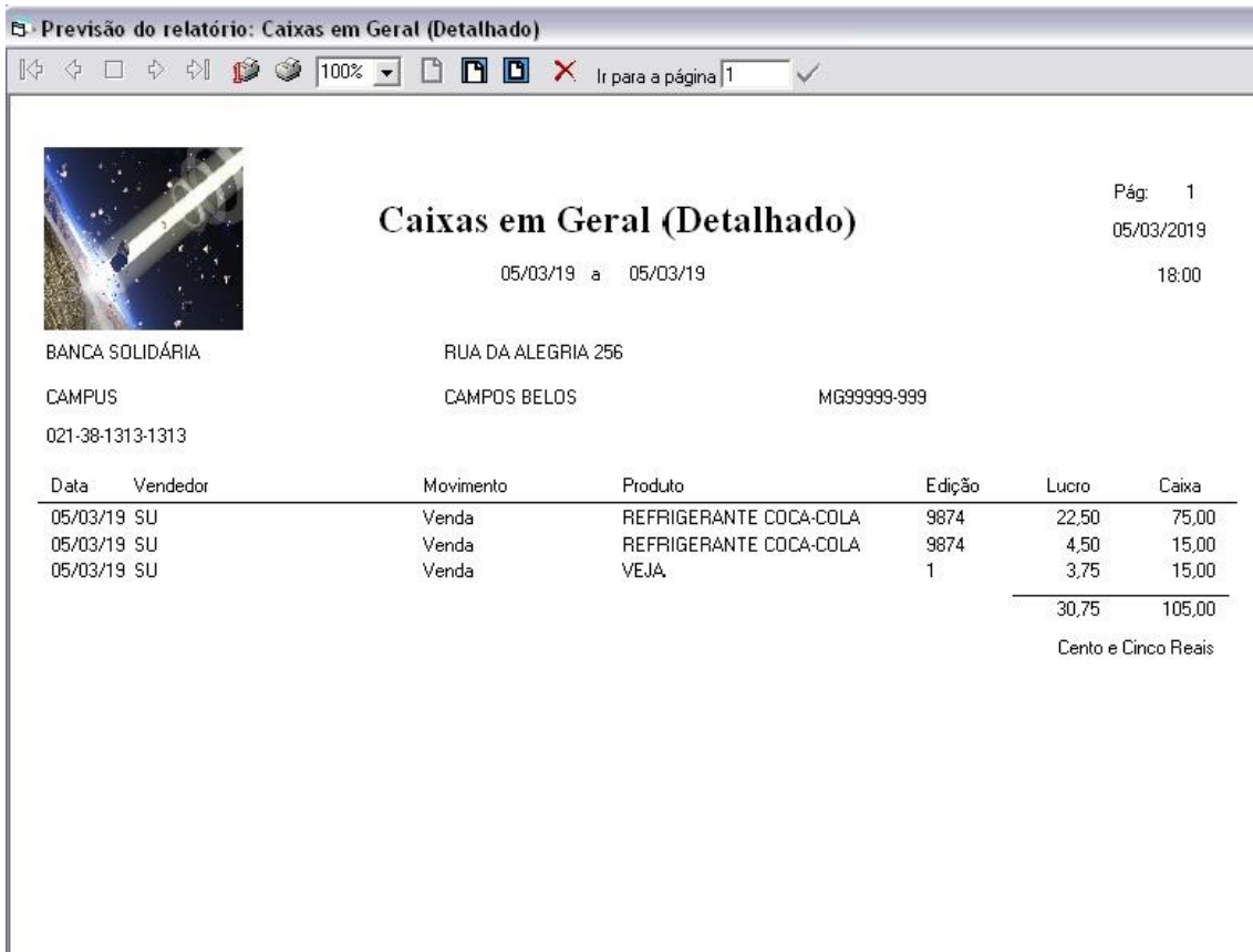
Relatório em tela do caixa detalhado